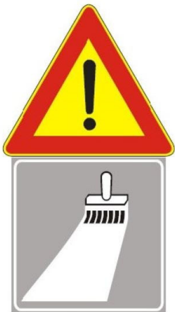
Figura Il 391 Art. 31