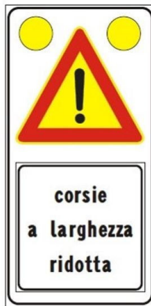
Figura Il 391c Art. 31